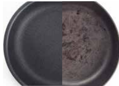
スーパーセラミックコーティング フッ素コーティング