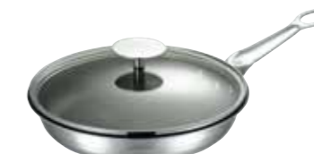
スーパーセラミックコーティングフライパン+ガラス蓋